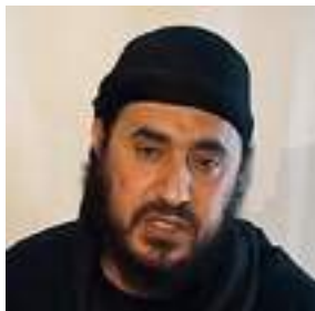
↑ Abou Moussab Al-Zarqawi

De los 54 informadores secuestrados en el mundo a finales de 2015, 26 lo estaban en Siria. En su mayoría eran periodistas locales, generalmente "detenidos" y juzgados por el Estado Islámico. El último de los secuestrados era el japonés Jumpei Yasuda,