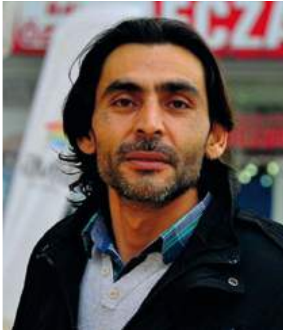
↑ Naji Jerf, periodista sirio asesinado en Turquía el 27 de diciembre de 2015