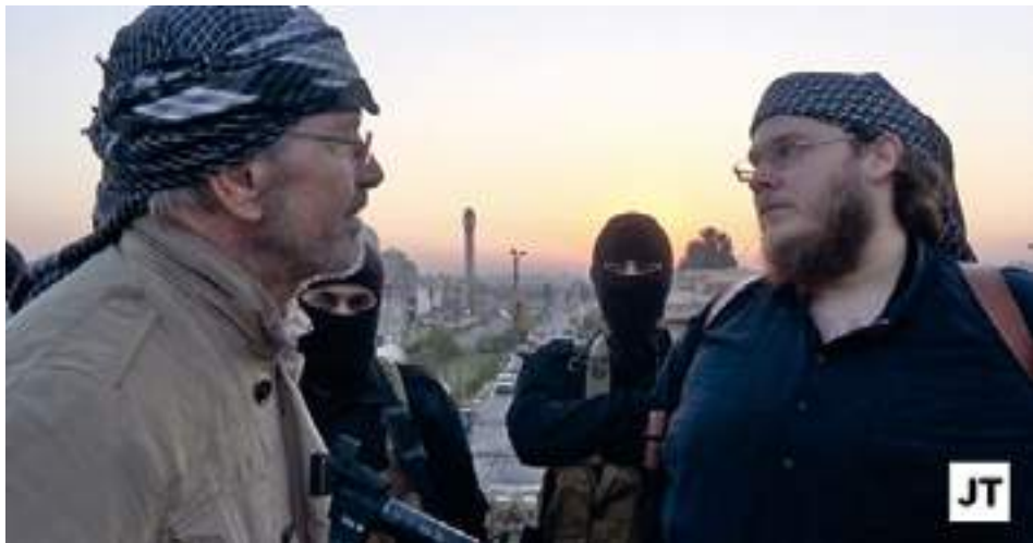
↑ El periodista alemán Jürgen Todenhöfer, durante una entrevista con un yihadista alemán en Siria.