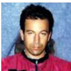
↑ Daniel Pearl (foto difundida por sus raptores)

capturado al poco tiempo de llegar a Siria, en Julio de 2014. Las ejecuciones se producen cuando fallan las negociaciones (por Kenji Goto llegaron a pedir 40 millones de dólares), o cuando se da prioridad a la política, como parece haber ocurrido en los casos de Foley y Sotloff, según Calliet. Los dos estadounidenses habrían muerto por represalias a la política de su país en la región.