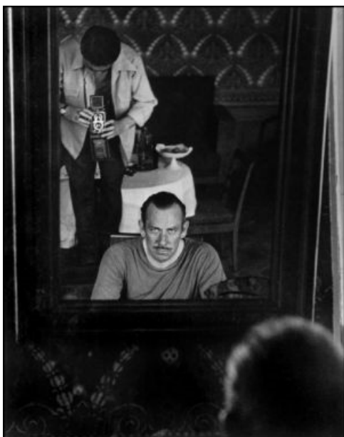
7. John Steinbeck. Moscú, agosto-septiembre de 1947.