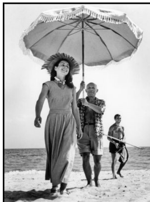
8. Pablo Picasso y Françoise Gilot. En el fondo, Javier Vilato, sobrino del pintor. Golfe-Juan, agosto de 1948.