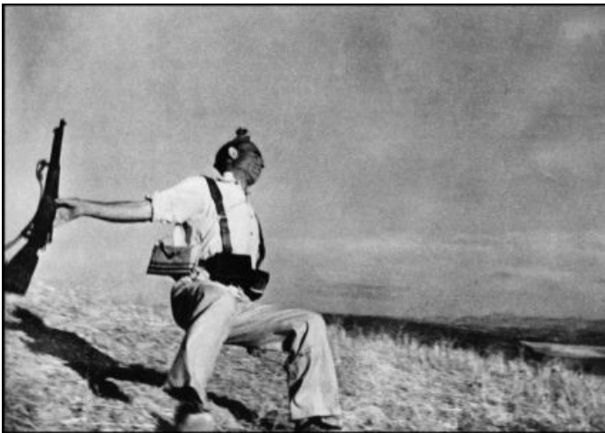
5. Republicano abatido. Frente de Córdoba, España, a principios de 1936.