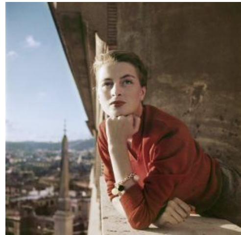
6. La modelo francesa Germaine Lefebvre, conocida como Capucine. ©Robert Capa – International Center of Photography/Magnum Photos Roma, 1951.