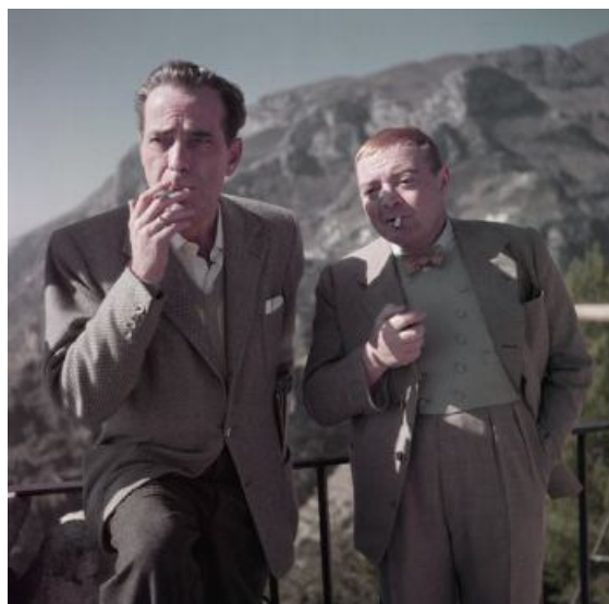
10. Humphrey Bogart y Peter Lorre en el rodaje de "La burla del diablo" de John Huston. Ravello, Italia, abril de 1953.