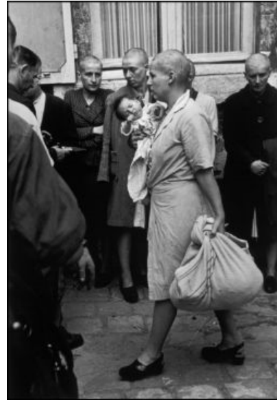
4. Nada más liberarse la ciudad, una mujer francesa que tuvo un hijo con un soldado alemán, lleva la cabeza rapada como señal de humillación. Chartres, Francia, 18 de agosto de 1945.