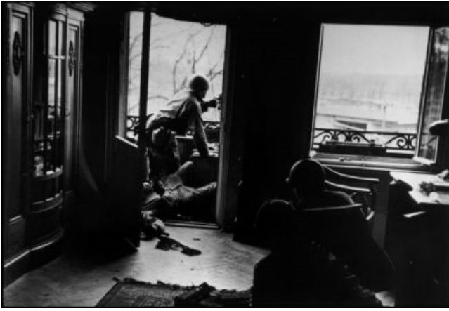
3. Francotirador, Leipzig, Alemania, 18 de Abril de 1945.