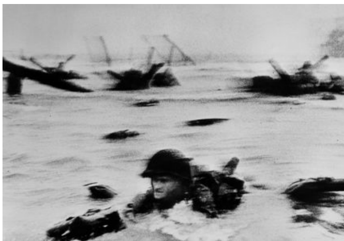
9. Desembarco de las primeras tropas estadounidenses. Playa de Omaha, Normandía, 1944.