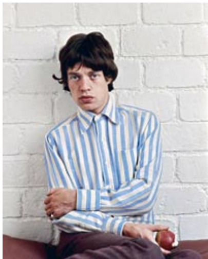
6 - Mick Jagger , Paris, 1965.

Apenas tengo recuerdos de ese momento, salvo que era en Central Park y que hacía buen tiempo.