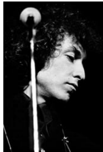
7 - Bob Dylan, Grande-Bretagne, 1966.

Hicimos esta foto en mi casa, de madrugada, al volver de Marsella.