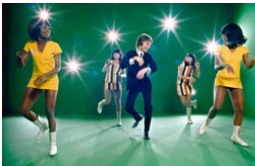
2 - CLAUDE FRANÇOIS , 1967. Cuando le conocí en 1963, vivía en el hotel Magda, cerca de la plaza de l'Etoile, en París, en una habitación pequeña forrada de fotos suyas en blanco y negro.

Esta foto con las chicas en el coche se hizo para la revista "Lui". Otro buen día.