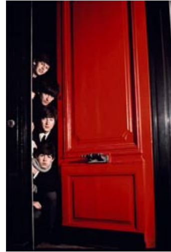
9 - The Beatles , Londres, 1964.

Representó el papel principal del musical "Hair" en Francia, cuyo éxito le debe mucho a su presencia.