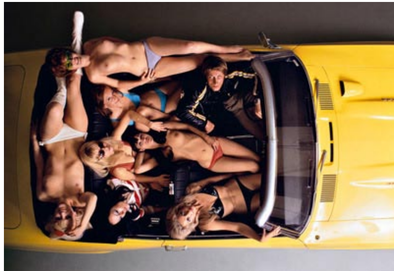
1 - Jacques Dutronc , París, 1969.

Email: rsf@rsf-es.org y prensa@rsf-es.org | Tel.: 91 522 40 31 y 652 91 51 53