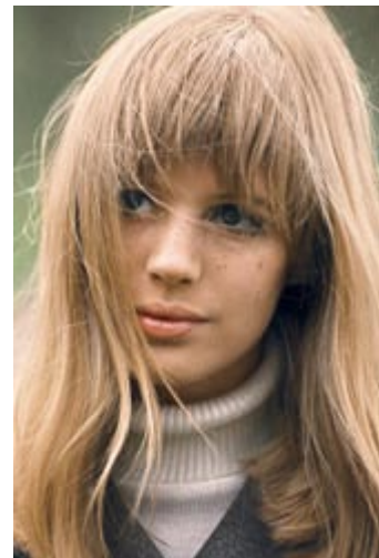
11 - Marianne Faithfull, Grande-Bretagne, 1966. - Si nos vimos mucho ese año, era sobre todo por el gusto de vernos. Ya era la princesa del "Swinging London".