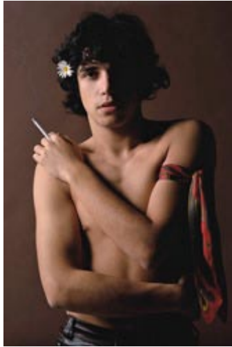
8 - Julien Clerc, Paris, 1969.

Representó el papel principal del musical "Hair" en Francia, cuyo éxito le debe mucho a su presencia.