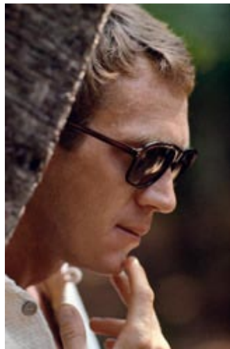
10 - Steve McQueen , Espagne, 1969. Este es el único artista con el que las cosas no fueron bien. Me hizo esperar tres días para darme cinco minutos. Probablemente un mal día ...

Primera sesión con ellos. Todavía no los veía como LOS BEATLES con una gran B y el resto, sólo era un grupo, sin más. La puerta era la de las oficinas de su agente Brian Epstein.