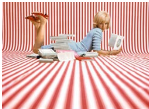
3 - Sylvie Vartan , París, 1964. Esta foto está inspirada en "Los paraguas de Cherburgo", la película de Jacques Demy