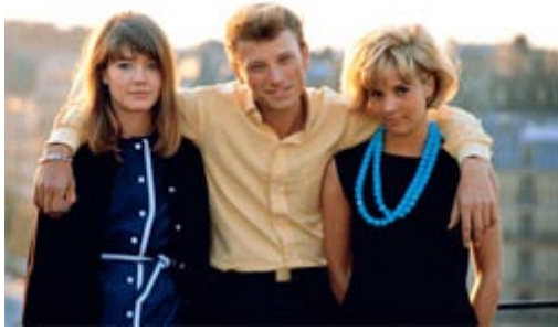
4 - Françoise Hardy, Johnny Hallyday, Sylvie Vartan, 1963.