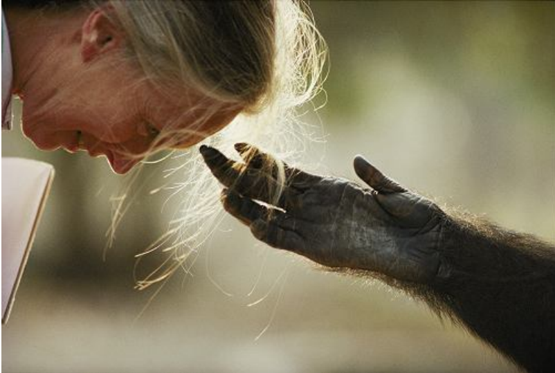
Jou Jou, chimpancé en cautiverio, se acerca a la doctora Jane Goodall.