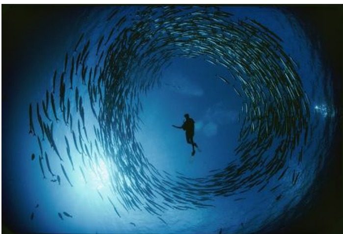
8 - DAVID DOUBILET. Naturalista atrapado en un torbellino de barracudas.