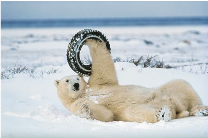
5 - NORBERT ROSING. Un oso polar juega con un neumático.