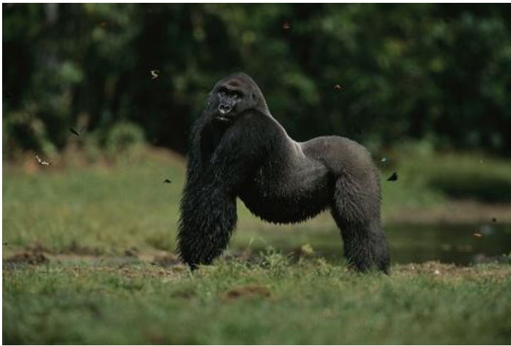
7 - NICK NICHOLS. Un gorila de espalda plateada en el Parque Nacional de Odzala-Kokoua.