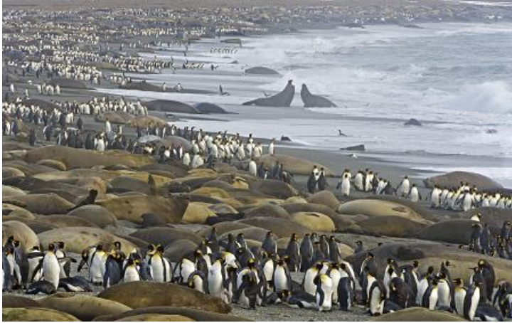
6 - JOHN EASTCOTT e YVA MOMATIUK. Los pingüinos rey se deslizan por compactos harenes de elefantes marinos del sur.