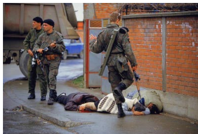
1. Ron Haviv

Obligatorio especificar el crédito en cada fotografía: © VII y el nombre del fotógrafo